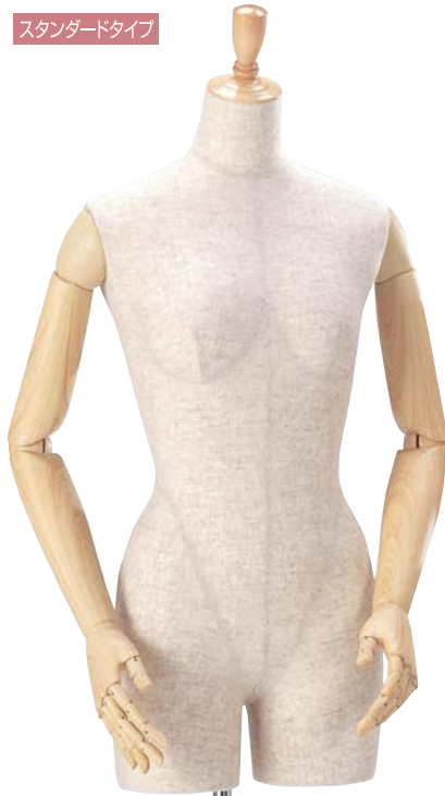
スタンダードタイプ