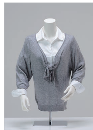
SBZT13-A34V-21 □本体: アイボリー塗装 B:80 W:58 肩幅:38cm □スタンド:BB21 パイプ: アルミφ19mm