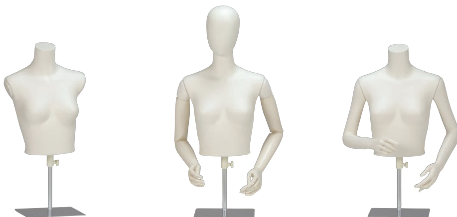
SBZE13-21 □本体: アイボリー塗装 B:80 W:58 肩幅:38cm □スタンド:BB21 パイプ: アルミφ19mm