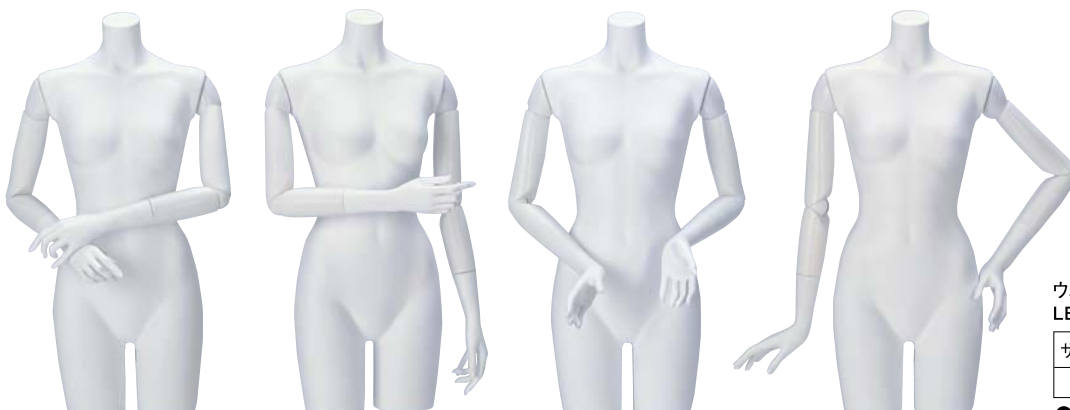
ウエストリフトトルソ サイズ LBT70サイズ ①③⑤⑦