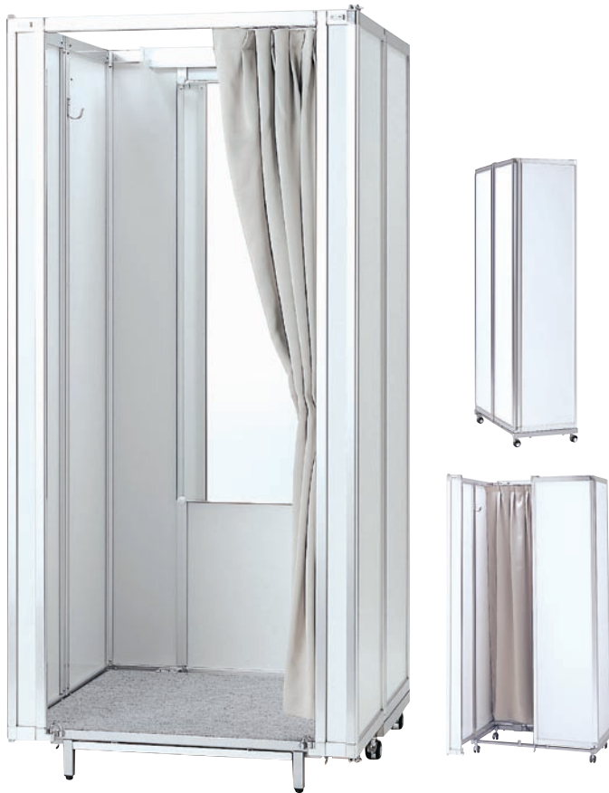
軽量ハードタイプ [SFR-01]