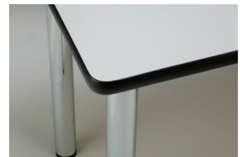
白ポリ天板 + 黒エッジ