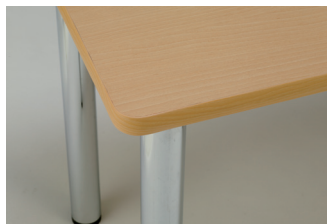
クリア木目ポリ天板 + クリア木目エッジ