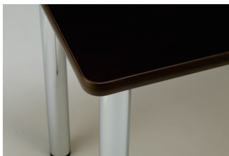
ブラウン木目ポリ天板 + ブラウン木目エッジ

天板小口に「ソフトエッジ」を採用することにより、天板の破損や小口のはがれを防止するとともに、売り場での安全性を向上いたしました。