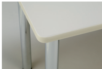
アイボリーポリ天板 + アイボリーエッジ