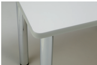
白ポリ天板 + ライトグレーエッジ