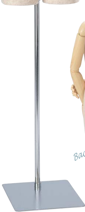
1 GJE51-A7 (スタンド別売)