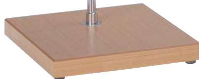
3 GJE51-A7 (スタンド別売)